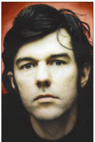
KOMMER: Stefan Sagmeister.

Hun er lokallagsleder for Grafill, en organisasjon som representerer det ledende fagmiljøet innen visuell kommunikasjon i Norge. De favner fagområdene grafisk design, illustrasjon, interaksjonsdesign, animasjonsdesign og tegneserieskapning. Sammen med de fire tromsøfirmaene Tank, Rød Tråd, Reibo og hk reklamebyrå har de sørget for å få gurun til byen.